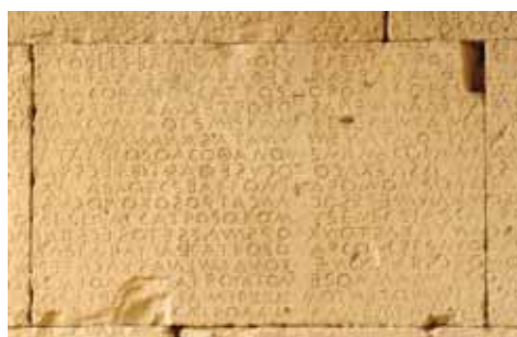
Τμήμα της Μεγάλης Επιγραφής της Γόρτυνας

Σε αυτό το σημείο οι Ρωμαίοι ενσωμάτωσαν την περίφημη επιγραφή των νόμων της Γόρτυνας (5ος αι. π.Χ.), η οποία στην αρχή ήταν χαραγμένη πάνω σε ένα κυκλικό κτίσμα, ώστε κάθε πολίτης να μπορεί να τους γνωρίζει. Στη ΒΔ (βορειοδυτική) πλευρά του Ωδείου υπάρχουν σήμερα τέσσερις σειρές από τις πλάκες αυτές, στεγασμένες με ένα θόλο που κτίστηκε από τους Ιταλούς αρχαιολόγους ανασκαφείς για να τις προστατεύσουν. Αποτελούν τα λείψανα των αρχαίων κωδίκων της Γόρτυνας, σπουδαιότατα κειμήλια για τη μελέτη της επιγραφικής, της γλώσσας και του ευρωπαϊκού δικαίου. Θεωρείται