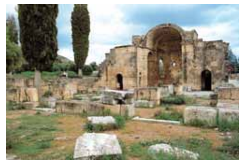
Η παλαιοχριστιανική βασιλική του Αγίου Τίτου